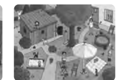
Illustration: Vera Brüggemann

D: Nicht für Kinder unter 3 Jahren geeignet: Verschluckbare Kleinteile